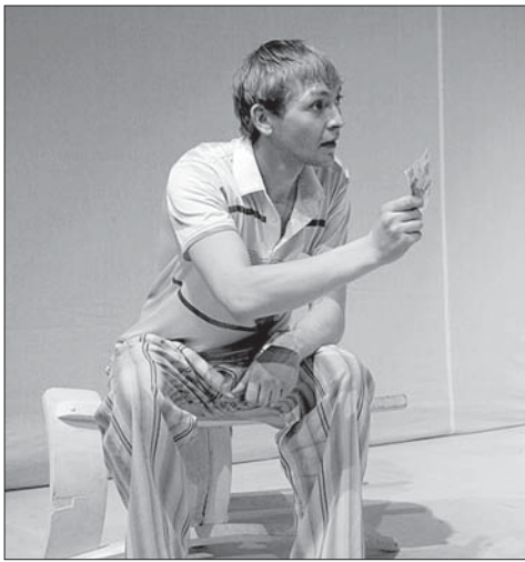
Театр-студия «Первый театр». Спектакль «Я фильм "Ирония судьбы, или С легким паром" от начала до конца ни разу не видел» http://www.1-teatr.ru