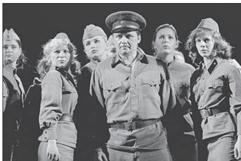
Театр музыкальной комедии. Спектакль «А зори здесь тихие...» http://www.muзkom.ru