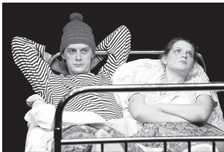
Сцена из спектакля «Семейный портрет с посторонним».